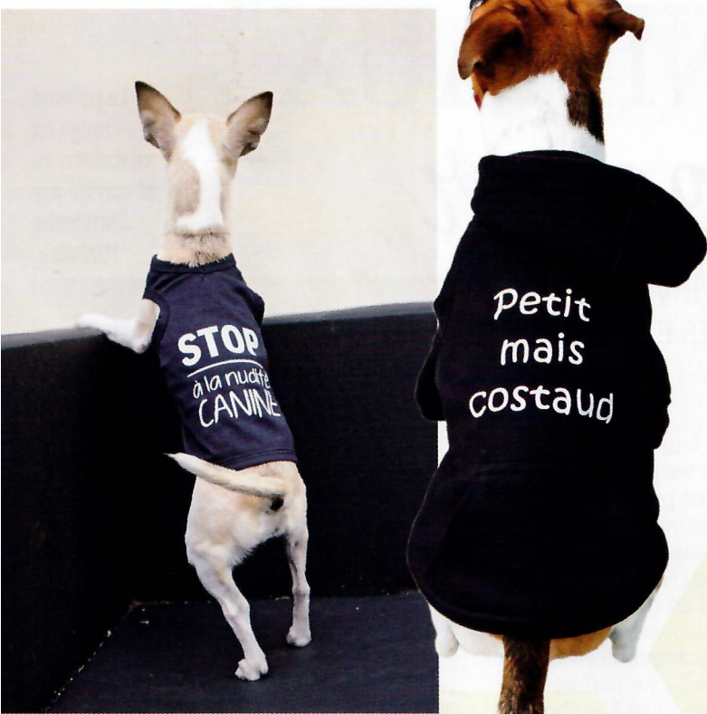
On s'exprime ! Cette année encore, on aime les messages percutants, en déco, en accessoires et même... en mode canine! Oh! Pacha