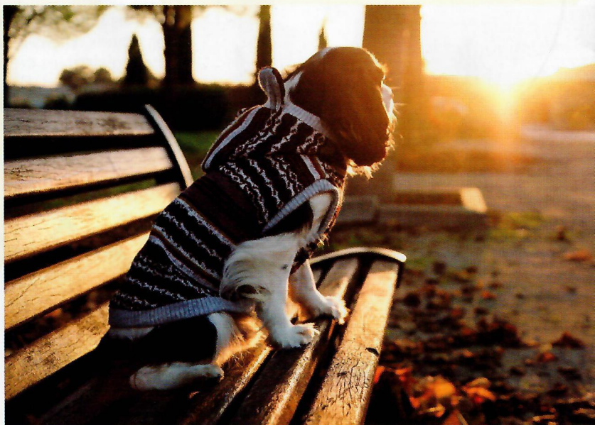
Un bon jacquard Le style gentleman-farmer, un bon atout séduction auprès de la gent féminine, humaine ou canine. Oh! Pacha