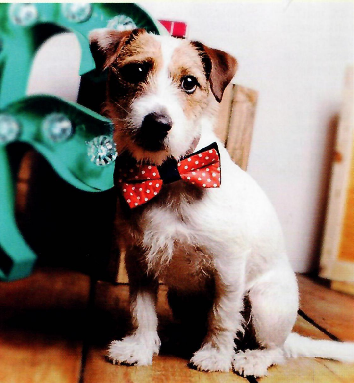
Tenue correcte exigée Le nœud pap', un accessoire qui a du chien. Suck UK