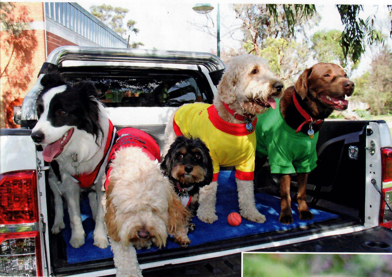
La coolitude du streetwear Sweat ou hoodie? Le style envahi la canine planète fashion. More than Paws